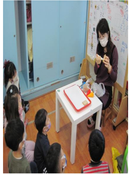
「討論分享創作材料」