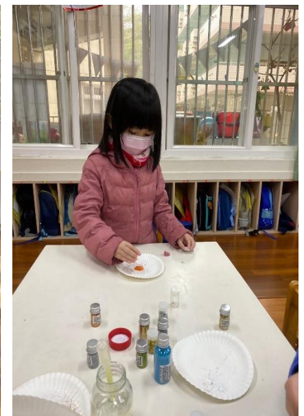
「幼兒動手創作聖誕水晶瓶」