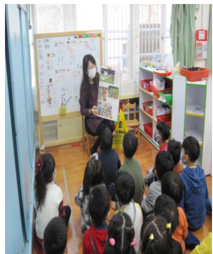
「透過故事和幼兒分享聖誕節的由來」