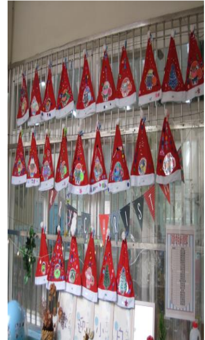
「發出可愛聖誕老人笑聲」