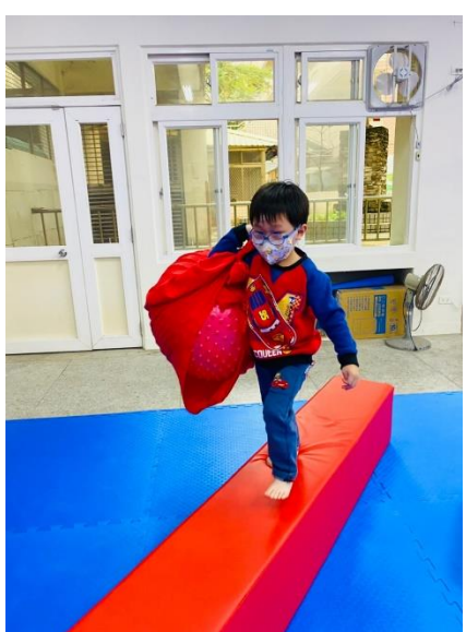
「一起動一動體驗不一樣的聖誕節」