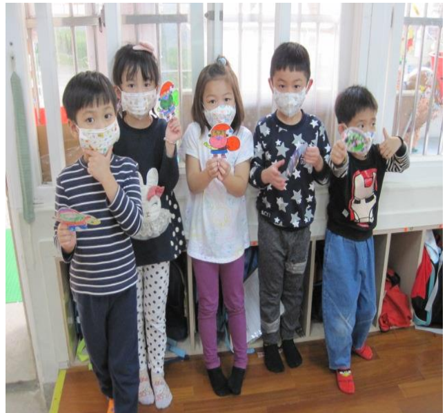
「想想看在聖誕節裡會有什麼樣的東西出現呢？」