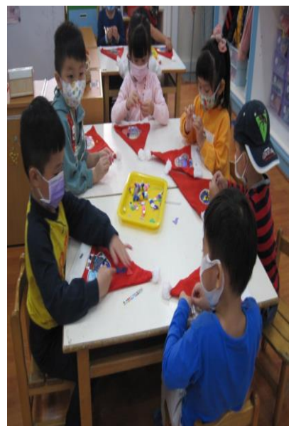
「幼兒一起討論創作聖誕帽的技巧」