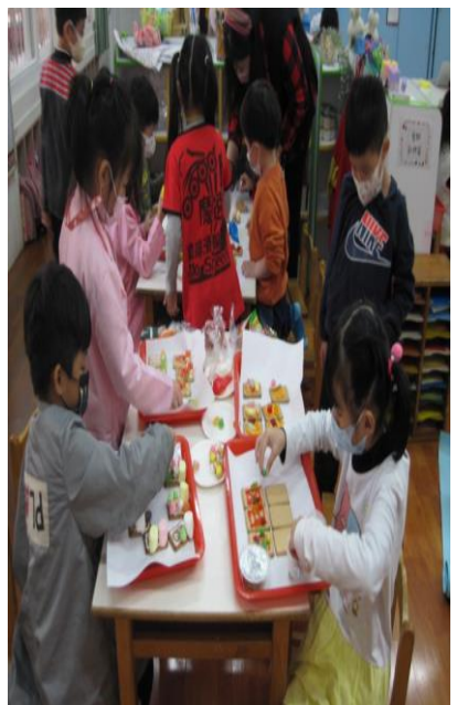
「開心進行聖誕餅乾創作」