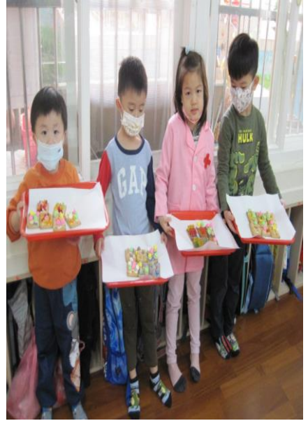
「聖誕餅乾創作完成了」