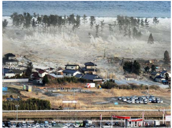
2011 年日本 311 大地震並引發海嘯，造成嚴重的人員傷亡及核電廠輻射外洩事件。