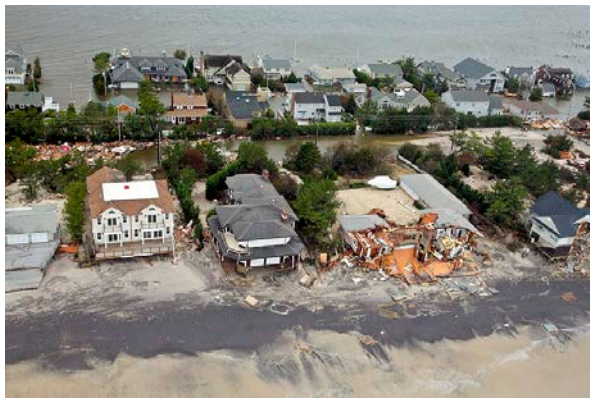
2012 年桑迪颶風侵襲美國，造成長灘島地區的房屋嚴重受損。