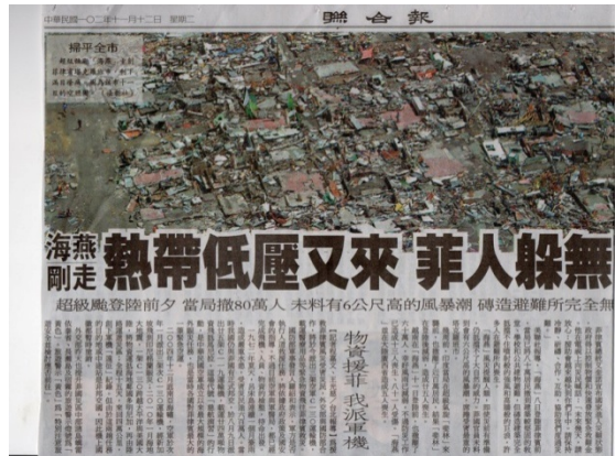
2013 年海燕颱風造成菲律賓嚴重傷亡與財產損失。